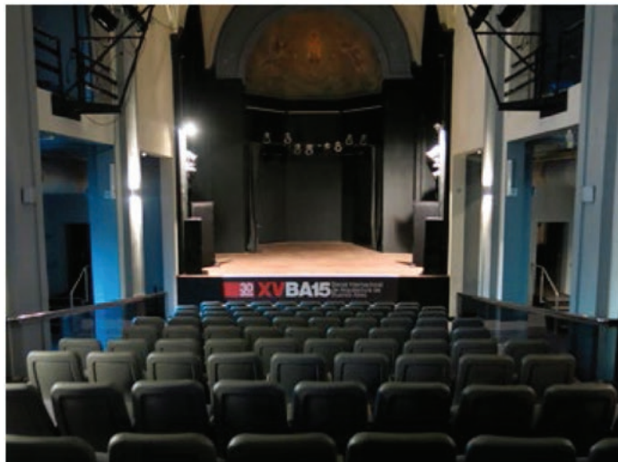
VISTA HACIA EL ESCENARIO

Espacios: descripción y especificaciones técnicas CAPILLA