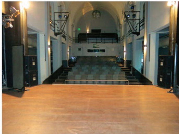
VISTA DESDE EL ESCENARIO